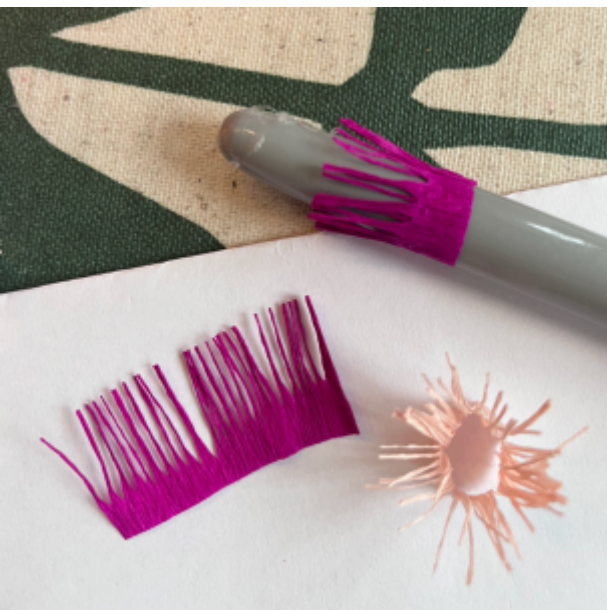
pyöräytä ja liimaa heteet esim. kynän avulla renkaaksi