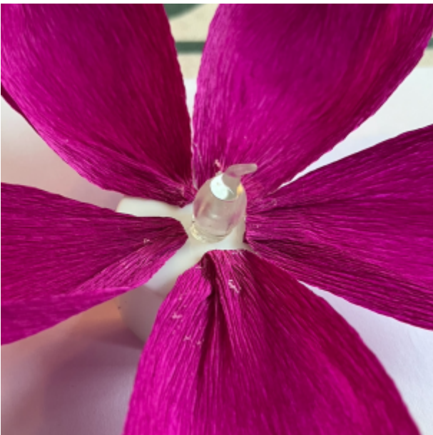
liimaa seuraava kerros edellisten väleihin