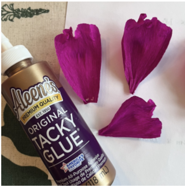
rypytä ja liimaa terälehtien kanta suppuun