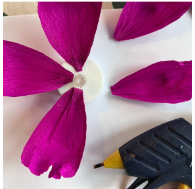
liimaa suurimmat lehdet kuuma-liimalla tuikun reunalle