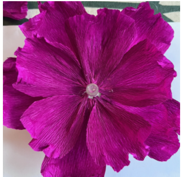
jatka kunnes kaikki lehdet on käytetty