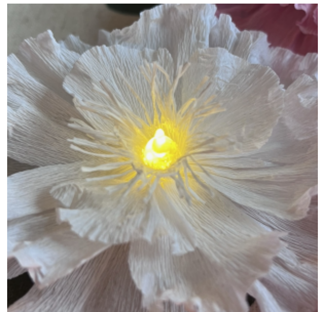
liimaa lopuksi heteet Tacky Glue-liimalla tuikun lampun ympärille